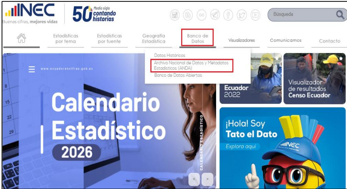
Ilustración 2 Acceso a banco de datos